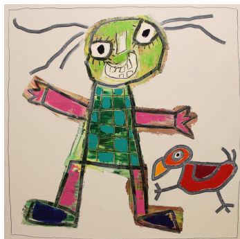
Gianfranco Asveri Favole in viaggio, 2019 Mixed media on canvas 100 x 100 cm