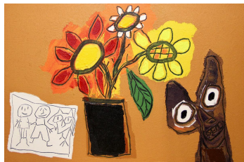
Gianfranco Asveri Favole in viaggio, 2019 Mixed media on canvas 60 x 90 cm