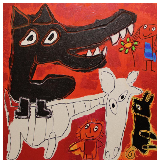
Gianfranco Asveri, Favole in viaggio, 2019 mixed media on canvas, 100 x 100 cm

ZZHK 畫廊欣然呈獻「詹弗蘭科·阿斯維里: 和他的小動物們」，義大利畫家詹弗蘭科·阿斯維里（Gianfranco Asveri）的個人新作展。四十多年來，阿斯維里不間斷地潛心創作，並形成了自己獨特的繪畫風格。此次在香港舉辦的首次個人畫展，將展出 15 幅阿斯維里專為此次展覽而創作的，最備受喜愛的小動物題材系列作品。